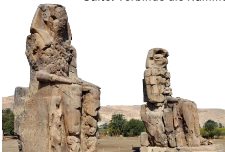
Die Memnonkolosse im Niltal

Im Hörquiz (🎧 4) erscheinen verschiedene Ausschnitte aus der Peer-Gynt-Suite . Verbinde die Nummern (Ansage) mit den dazugehörigen Titeln.