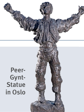
Peer-Gynt-Statue in Oslo